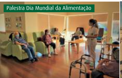
Palestra Dia Mundial da Alimentação