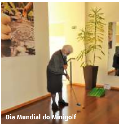
Dia Mundial do Minigolf