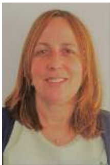
Sandra Santos Comunicação

A nossa história....na 11ª edição do Boletim Institucional