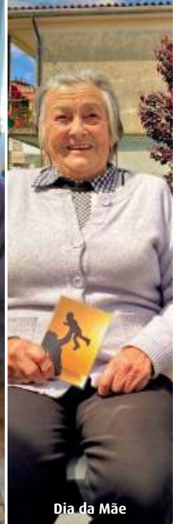
Dia da Mãe