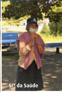
Srª da Saúde