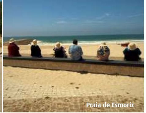
Praia de Esmoriz