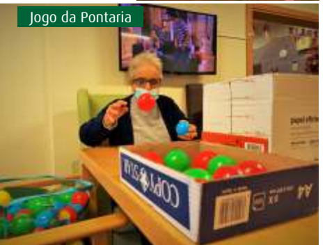
Jogo da Pontaria