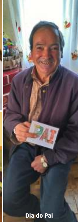
Dia do Pai