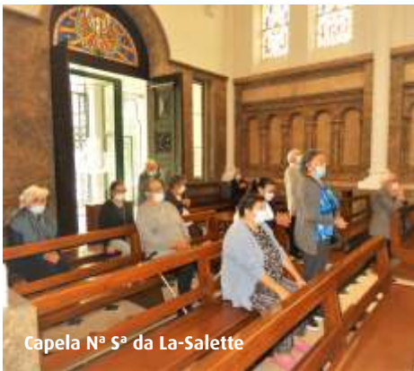
Capela Nª Sª da La-Salette