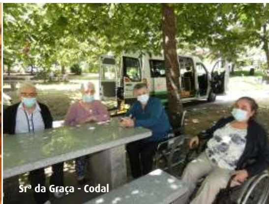
Srª da Graça - Codal