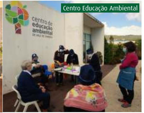
Centro Educação Ambiental