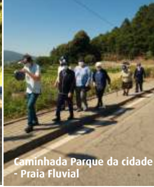
Caminhada Parque da cidade - Praia Fluvial