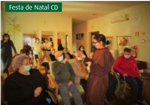
Festa de Natal CD