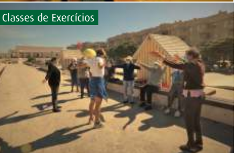
Classes de Exercícios