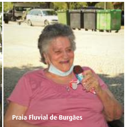
Praia Fluvial de Burgães