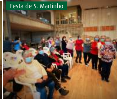
Festa de S. Martinho