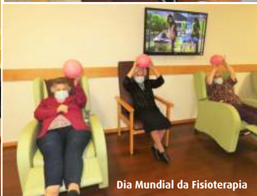
Dia Mundial da Fisioterapia