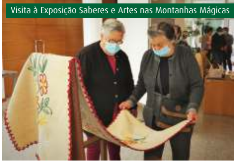
Visita à Exposição Saberes e Artes nas Montanhas Mágicas