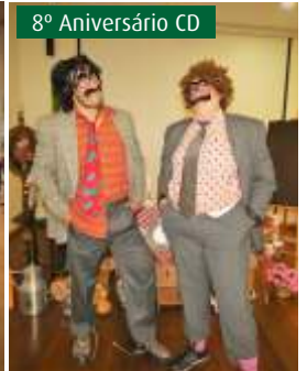
8º Aniversário CD